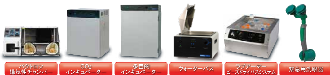
バクトリン 嫌気性チャンバー CO 2 インキュベーター 多目的 インキュベーター ウォーターバス ラブアーマー ヒートドライバシステム 緊急用洗眼器

仕様・デザイン・価格変更および生産中止等、予告なく実施される場合がございます。納品までに期間を要する場合もございます。掲載の数値等は基準値につき、ご使用条件により異なる場合があります。あくまでも選定の目安としてご覧ください。各種作業に応じて安全に関する知識および経験を有する指導者のもとでご使用ください。ご使用前には目視等で破損等の異常の有無を確認し、テスト・点検を行い安全を確認した上でご使用ください。不良・破損等によって誘発される二次的損失については対応いたしかねます。予めご理解のほどお願いします。印刷物のため、実物と色が多少異なる場合がございます。価格はすべて税抜です。