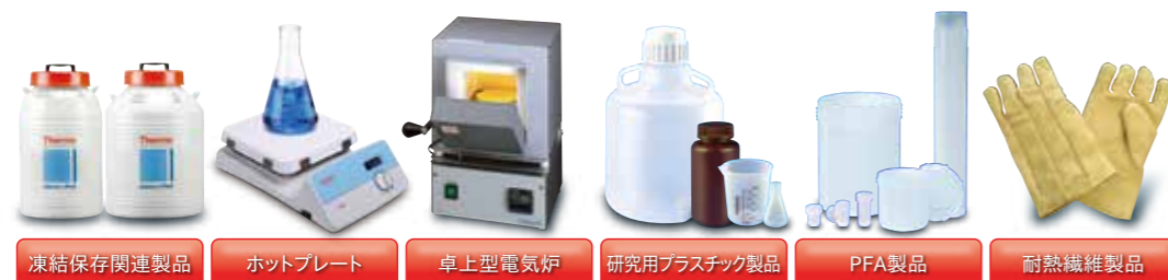
凍結保存関連製品 ホットプレート 卓上型電気炉 研究用プラスチック製品 PFA製品 耐熱繊維製品

東栄では各種理化学関連製品を取り扱っています。 カタログご希望・お問い合わせなど、お気軽にご相談ください。