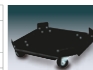
高さ: 約13cm。ストッパー機能はございません。