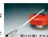
バイオケン20には使用できません。先端のゴムは液体窒素に浸けると劣化するため、液体窒素を取り出してからの使用をお勧めいたします。蓋は付属しません。