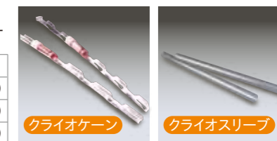
バイアルは付属していません。