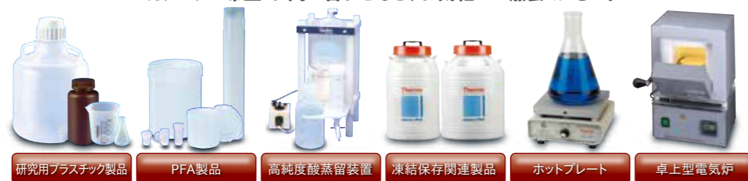
研究用プラスチック製品 PFA製品 高純度酸蒸留装置 凍結保存関連製品 ホットプレート 卓上型電気炉

東栄では各種理化学関連製品を取り扱っています。 カタログご希望・お問い合わせなど、お気軽にご相談ください。