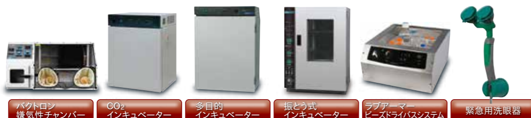
バクトロン嫌気性チャンバー CO 2 インキュベーター 多目的インキュベーター 振とう式インキュベーター ラブアーマービーストライバシステム 緊急用洗眼器

仕様・デザイン・価格変更および生産中止等、予告なく実施される場合がございます。納品までに期間を要する場合がございます。掲載の数値等は基準値につき、ご使用条件により異なる場合があります。あくまでも選定の目安としてご覧ください。各種研究に応じて安全に関する知識および経験を有する指導者のもとでご使用ください。ご使用前には目視等で破損等の異常の有無を確認し、テスト・点検を行い安全を確認した上でご使用ください。不良・破損等によって誘発される二次的損失については対応いたしかねます。予めご理解のほどお願いします。研究用のため医療・動物実験等には使用できません。印刷物のため、実物と色が多少異なる場合がございます。価格はすべて税抜です。